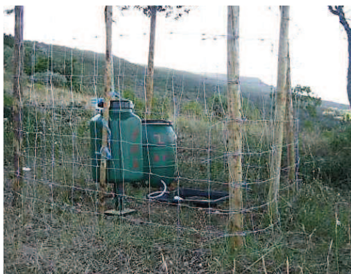
Figura 7 – Exemplo de Comedouro.

Comedouros: Fornecimento e instalação dos comedouros de depósito em PVC com tampa de enroscar e presilha para suspensão com capacidade de 30Lt e mola doseadora em metal; armação em metal para suspensão de comedouros e protecção em metal, que impeça o acesso a predadores. A Rede metálica cinegética ( \varnothing 2 mm), a instalar com malha de 100mm(L)x70mm(A) ou no máximo 100mm(L)x100mm(A).