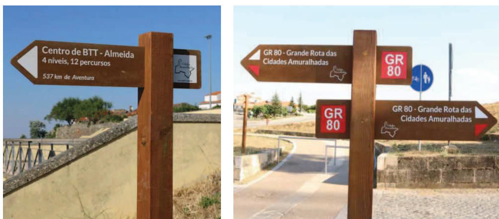
Figuras 3 e 4 – Exemplos de tipologia de sinalética a utilizar

A direcção de cada placa e os dados a inscrever em cada placa serão definidos pelo Técnico da Entidade Adjudicante.