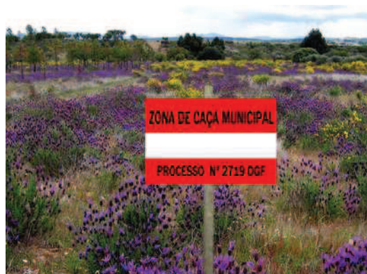
Figuras 1 e 2 – Modelo 2 e exemplo de instalação