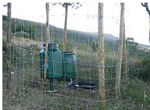
Figura 5 – Exemplo de Comedouro.

em metal, que impeça o acesso a predadores. A Rede metálica cinegética ( \varnothing 2 mm), a instalar com malha de 100mm(L)x70mm(A) ou no máximo 100mm(L)x100mm(A).