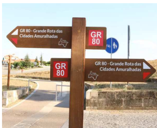
Figuras 1 e 2 – Exemplos de tipologia de sinalética a utilizar