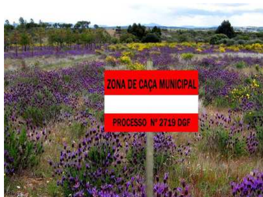
Figuras 1 e 2 – Modelo 2 e exemplo de instalação