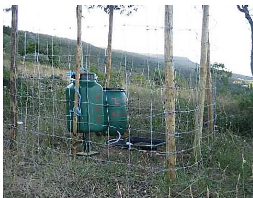
Figura 7 – Exemplo de Comedouro.

Comedouros: Fornecimento e instalação dos comedouros de depósito em PVC com tampa de enroscar e presilha para suspensão com capacidade de 30Lt e mola doseadora em metal; armação em metal para suspensão de comedouros e protecção em metal, que impeça o acesso a predadores. A Rede metálica cinegética ( \varnothing 2 mm), a instalar com malha de 100mm(L)x70mm(A) ou no máximo 100mm(L)x100mm(A).