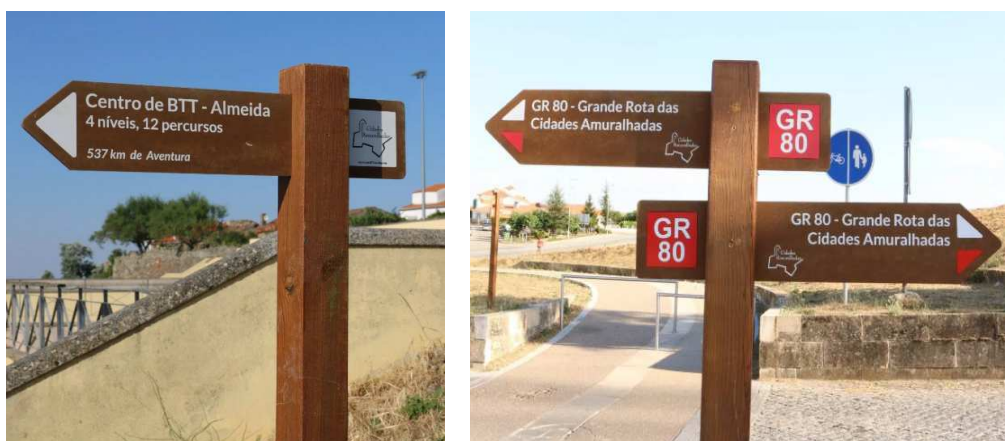
Figuras 3 e 4 – Exemplos de tipologia de sinalética a utilizar

A direcção de cada placa e os dados a inscrever em cada placa serão definidos pelo Técnico da Entidade Adjudicante.